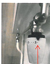
ca 21 grader

Med vänliga hälsningar, Platsledningen på Byggmästargruppen