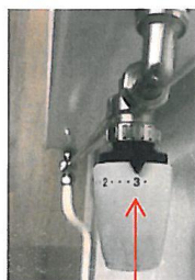
ca 20 grader

Skalan på termostaten ger ungefärlig rumstemperatur: