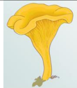
HSB BRF KANTARELLEN 11